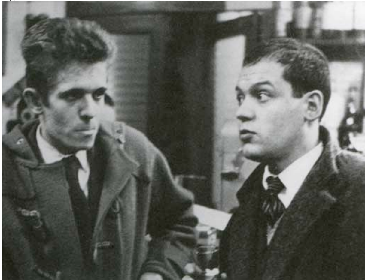
Con Piero Manzoni al Bar Giamaica, Via Brera 22, Milano

1957 - Prima mostra personale alla Galleria Totti di Milano con uno scritto di Roberto Sanesi. Riceve il premio Mochetti " Tavolozza D'Argento " al Circolo della Stampa di Milano. Inizia a lavorare la ceramica che però abbandona quasi subito; la riprenderà solo nel 1990. Con Piero Manzoni firma il manifesto contro il Premio San Fedele in nome dell'Avanguardia, organizzando una contro-mostra al bar Giamaica.