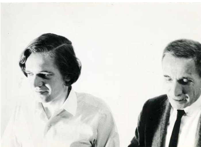
Immagine con Dino Buzzati

La Galleria Odissea di Roma si interessa a lui e compra dei quadri delle “Impronte” . Riceve il premio di Pittura “Cesare da Sesto” a Sesto Calende. Incontra Dino Buzzati e nasce una grande amicizia. Gli dedica un lungo articolo su “Rassegna” n. 5, Milano.