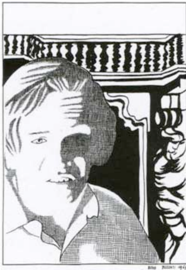
Con Dino Buzzati e ritratto di Antonio Recalcati di Dino Buzzati per "Poema a fumetti"